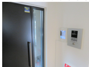
エントランスのオートロック

お客様: まず、冒頭で申し上げたオートロックで入れなくなってしまうケースなどは、おかげさまで一切無くなりました。顔認証なので、そもそもオートロックを開けるために鍵は必要ないですからね。それからもう一つ大きなメリットだと感じることは、何か予期せぬことが起こった際に入居者の方の入出履歴が簡単に確認できる点です。セキュリティという点で、例えばお部屋から何日も出てこないというケースや何日も戻っていないという場合など、単身世帯だと何か犯罪に巻き込まれていたり、部屋の中で倒れていたりするなどしても誰も気づいてあげられない可能性も十分あります。一方、気になった際に入出履歴を確認することで入居者の方の異常事態を早期に気づくことができ、離れた家族や会社の方と情報共有したりすることも出来るのではないかと考えています。勿論、防犯カメラで一人ひとりの履歴を確認することも可能ですが、さすがに現実的な手段ではありませんから。